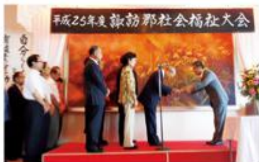
表彰規定第二条第一号該当者表彰