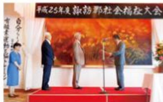
表彰規定第二条第三号該当者表彰