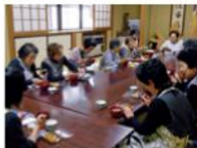
四王にここにご昼食会

福祉に関する各制度が改正され、運営面でも厳しさがありますが、利用者に向けた制度への対応を行い「誰もが住みなれた地域で、健康で安心して暮らせる町づくり」を進める組織としての共通認識を確認し、部門間の枠を取り外し働きやすい環境づくりをすすめ、地域社会とのつながりを大切に住民主体の地域福祉を推進し、事業に積極的に取り組んでまいります。