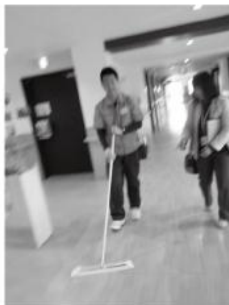
プライバシー保護のため、写真を加工しています。

母は確信した。いつかこの子にもこの仕事ができる日が来るだろう。職場の方々の見守りが温かく、根気よく育てていこうという気持ちにさせられる実習だった。