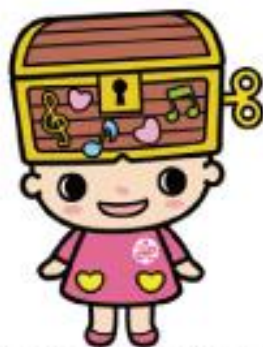
下諏訪町社会福祉協議会 「ゆるキャラ」 オルニコットちゃん

最後になりますが、皆様のご多幸をご祈念申し上げ、新年のあいさつとさせていただきます。