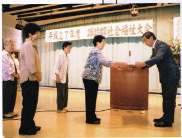
赤砂にこにこ昼食会ボランティアの皆様