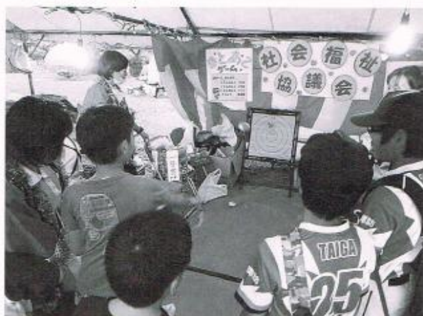
夜店（的あてゲーム）と演芸（健康体操）で参加しました