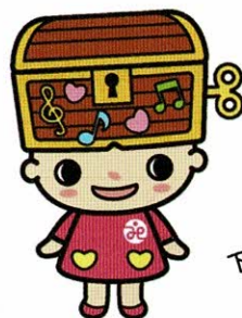
下諏訪町社会福祉協議会 キャラクター オルニコットちゃん

下諏訪町社会福祉協議会では『さりげなく、ともに生きる！！「おもいやりの町、しもすわ」をめざして』をスローガンに掲げ、行政との連携強化及び住民主体の地域福祉の推進を図るとともに、地域に貢献するために設置されている法人であるという責務を果たしながら事業に取り組んでまいります。