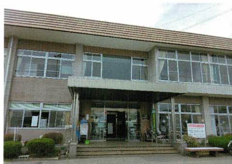
下諏訪町老人福祉センター