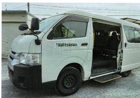
こちらの車で送迎いたします