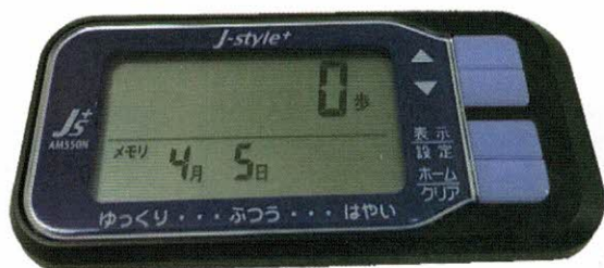
(株式会社アコース 無線通信活動量計)